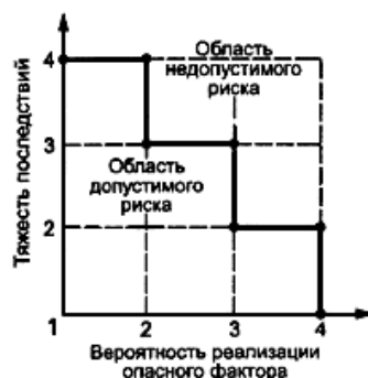
Рисунок Б.1 - Диаграмма анализа рисков

Если точка лежит на границе или выше границы, фактор учитывают, если ниже - не учитывают.